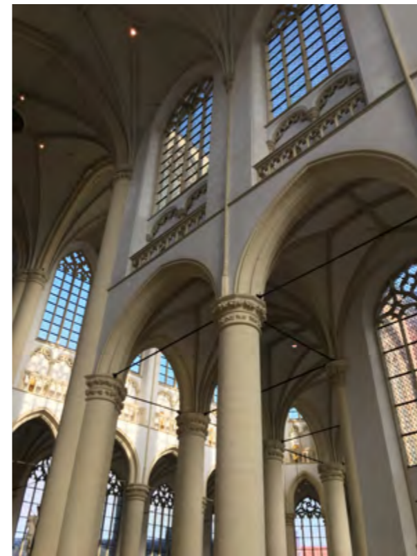
Hooglandse Kerk, Leiden

Pseudobasilieken hebben een schip dat wel hoger is dan de zijbeuken, maar dat geen eigen vensters bezit.