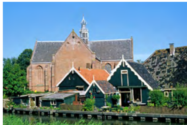
Grote Kerk Oosthuizen

Het voordeel van zo'n dwarsbeuk is onder meer dat het plaats biedt aan extra altaren, namelijk tegen de oostwand van die armen. De dwarsbeuk maakt de kerk ook visueel veel ruimer. Kruiskerken missen nogal eens een westtoren, maar hebben een dakruiter precies midden op de kruising. Daarin hangt de klok, die vanuit het midden van de kerk geluid werd.