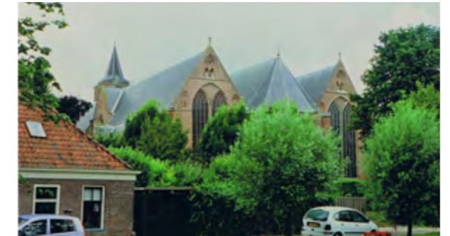
Grote Kerk van Edam

Kleinere steden hadden meestal hallenkerken (Amsterdam, Amersfoort, Weesp en Naarden). Dit zijn meerschepige kerken, waarvan de zijschepen even hoog zijn als het middenschip, dus kerkgebouwen van twee of meer beuken van ongeveer gelijke hoogte en meestal ook ongeveer gelijke breedte.