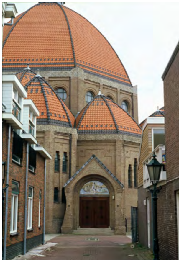
St. Agathakerk met koepel, ontwerp Th. J. Cuypers, Beverwijk

Het Pantheon in Rome is het oudste gebouw in centraalbouw met koepelgewelf. In de renaissance en de barok herleeft de belangstelling voor de centrale aanleg, vooral met toepassing van koepel(s).