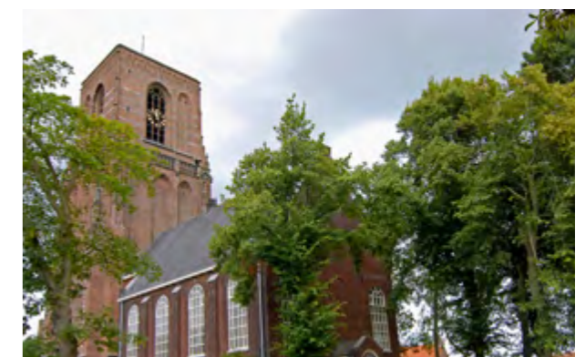
Toren van de kerk van Ransdorp