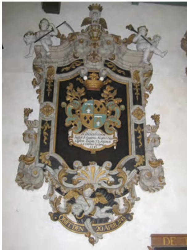
Rouwbord, kerk van Hegebeitum