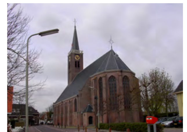
Grote Kerk van Schermerhorn, pseudobasiliek

Behalve dat oude kerkgebouwen (zaalkerken, kruiskerken, hallenkerken, basilieken en pseudobasilieken) hersteld werden, moesten er ook geheel nieuwe worden gebouwd. Deze nieuwe kerken sloten aan bij de oude kerktypen, maar zij konden in eigentijdse stijl worden uitgevoerd.