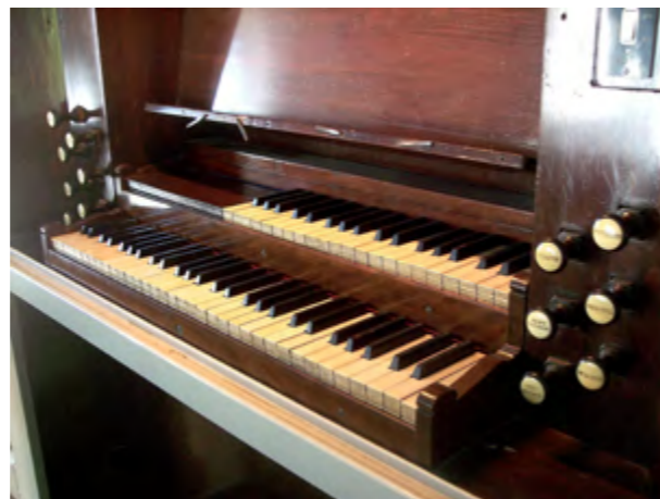
Orgel kerk van Haringhuizen, klaviatuur

Windlade – doos waarop de pijpen opgesteld staan