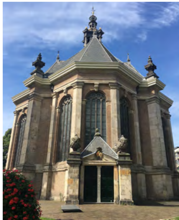
Centraalbouw, Nieuwe Kerk, Den Haag