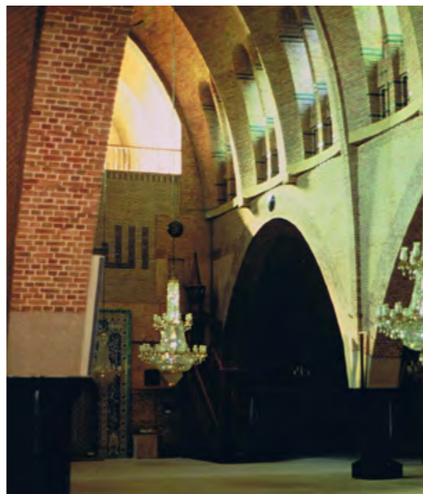
Moskeeën zijn soms gevestigd in een voormalig kerkgebouw. De moskee aan de Rozengracht in Amsterdam was eerder in gebruik als tapijthaal, maar werd oorspronkelijk gebouwd als rooms-katholieke kerk

De mihrab is de nis die de gebedsrichting aangeeft.