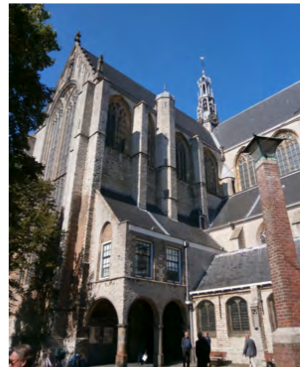
Grote of St. Laurenskerk, Alkmaar

Veel laatmiddeleeuwse dorpskerken zijn te beschouwen als verkleinde en vereenvoudigde navolgingen van grote stadskerken (kruisbasilieken). Zo zijn de eenbeukige kruiskerken met hun kruisingtorentjes in zekere zin verkleinde versies van de grote kruisbasilieken van bijvoorbeeld Haarlem en Alkmaar.