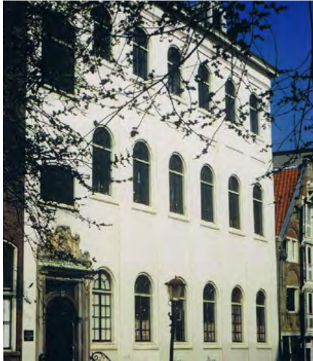
Armeense kerk, Amsterdam

Enkele parochies kunnen samen een dekenaat vormen, onder leiding van een deken .