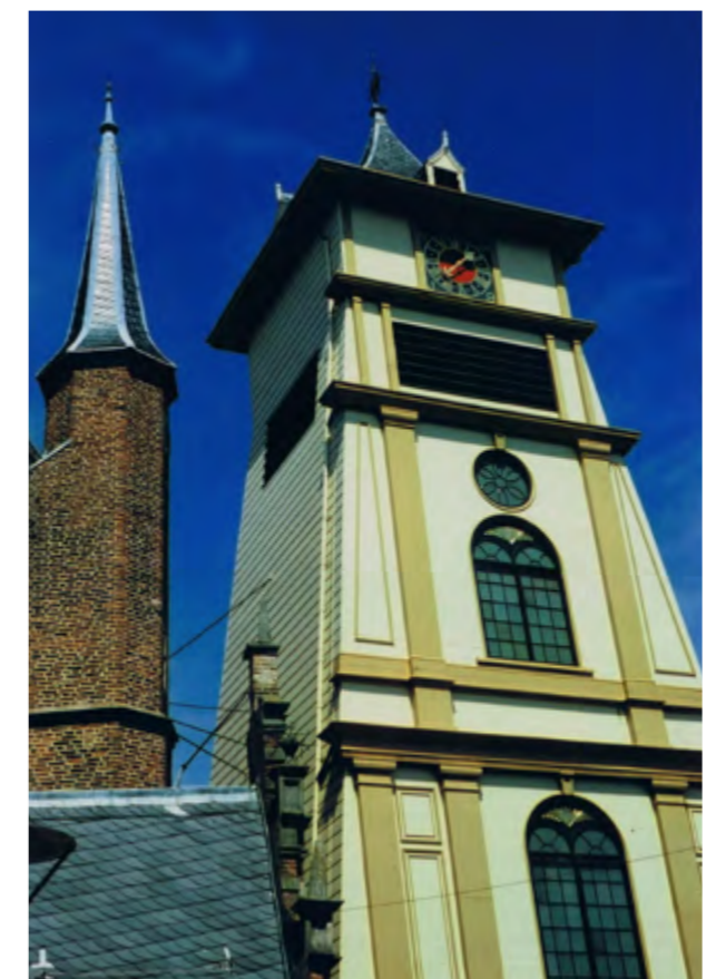
Houten toren naast de Westerkerk, Enkhuizen