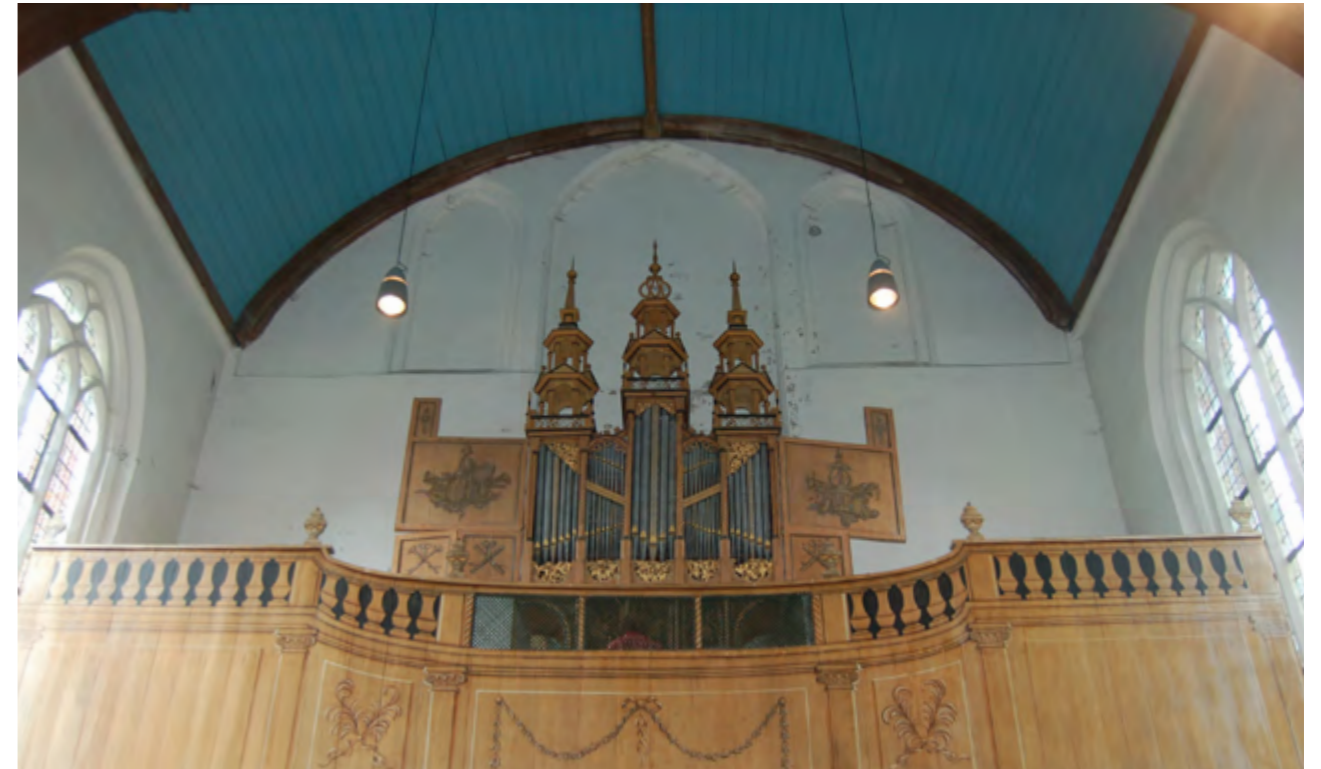
Orgel in de Grote Kerk van Oosthuizen, een van de oudste orgels van Europa